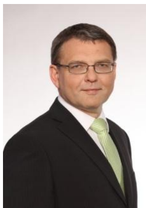
Lubomír Zaorálek, ministr zahraničních věcí ČR

Do iniciativy EYD2015 se zapojily členské státy EU, které budou včetně České republiky ve spolupráci s neziskovým a soukromým sektorem i dalšími partnery pořádat aktivity zacílené zejména na osvětovou a vzdělávací činnost. Věřím, že se letos díky této iniciativě občané ČR dozvědí více o smyslu a přínosech rozvojové spolupráce, jež povede k jejich zvýšenému zájmu i podpoře českého, respektive unijního úsilí v partnerských zemích.