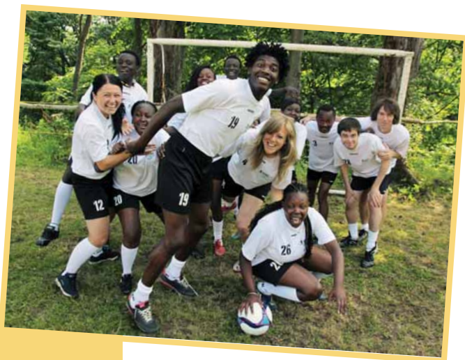
Tým fotbalu pro rozvoj 2013, Foto © INEX-SDA, Tomáš Princ

Shrnutí: Vyhodnocení představuje nástroj pro zaznamenání zkušenosti z komunikace, poučení se z úspěchů i chyb a vylepšení komunikace v dalších obdobích či kampaních. Mělo by být součástí všech komunikačních projektů, a to i za cenu, že se svým rozsahem přizpůsobí aktuálním kapacitám organizace.