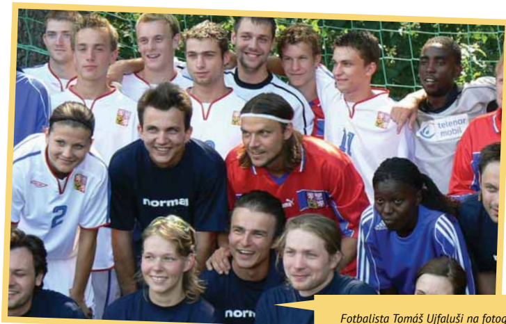
Fotbalista Tomáš Ujfaluši na fotografii projektu Fotbal pro rozvoj.