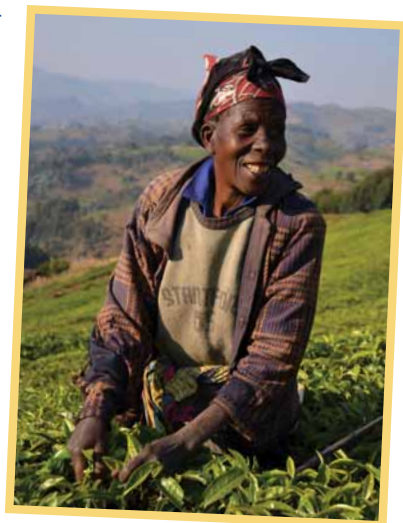
Čaj patří mezi hlavní vývozní suroviny Rwandy.

Shrnutí: „6P“ pomáhá s průběžným budováním dobrého jména vaší organizace a je podporou fundraisingu. Pokuste se je zohlednit při plánování komunikačních aktivit a průběžně se k nim vracet. Pomohou vám zorientovat se i ve chvílích, kdy si nebudete jisti, kam vás komunikace zavedla. Můžete porovnat kroky, které jste učinili, s kroky popsány v „6P“ a zjistit, zda jste nezapomněli na něco důležitého. Jakmile vstupují do hry další cíle komunikace, například snaha o změnu postoje veřejnosti k nějaké otázce, je nutné komunikační kampaň plánovat i s ohledem na další faktory popsané v následujících kapitolách této publikace.