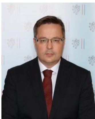
Martin Tlapa náměstek ministra zahraničních věcí ČR

Evropský rok pro rozvoj 2015 je vhodnou příležitostí, aby se rozvojová spolupráce stala vlajkovou lodí české diplomacie.